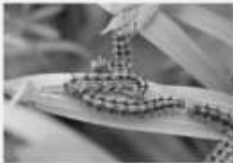
La Petite tortue Aglais urticae