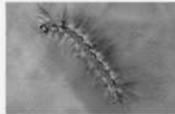
La Lithosie quadrille Lithosia quadra

Ces chenilles peuvent provoquer de légères réactions cutanées en cas de contact avec la peau, généralement comparables à des piqûres d'orties. Ces réactions ne sont pas systématiques et concernent surtout les personnes à la peau fragile ou sensible .