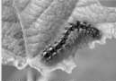
La Noctuelle de la patience Acrionicta rumicis