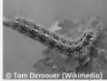
L'Ecoille chinée Euplagia quadripunctaria