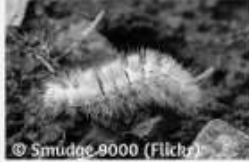
La Pudibonde Calliteara pudibunda