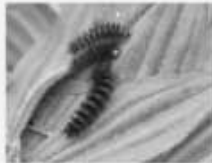
La Mélitée du plantain Melitaea cinxia