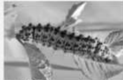
Le Petit paon de nuit Saturnia pavonia