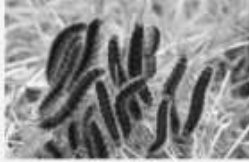
La Franconienne Malacosoma franconica