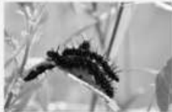
Le Paon du jour Aglais io