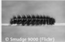
Le Bombyx de la ronce Macrothylacia rubi