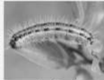
Le Gazé Aporia crataegi

Ces chenilles ne sont pas considérées comme urticantes, malgré la présence de poils ou de soies épineuses sur leur corps. Elles peuvent être manipulées et déplacées à main nue sans problème.