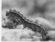
Le Manteau pâle Eilema caniola