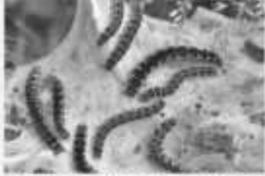
La Laineuse du cerisier Eriogaster lanestris