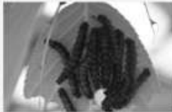
La Grande tortue Nymphalis polychloros