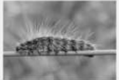
L'Ecaille martre Arctia caja