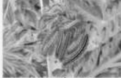
La Liurée alpine Malacosoma alpicola