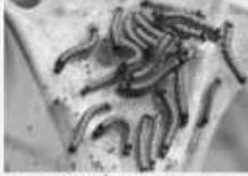
La Liurée des arbres Malacosoma neustria