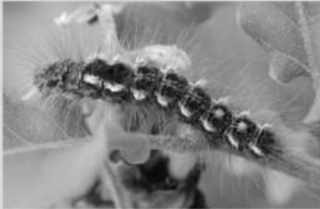
Le Bombyx cul-brun Euproctis chrysorrhoea

Ces trois espèces possèdent des soies urticantes pouvant générer d'importantes réactions allergiques, voire des problèmes respiratoires ou des troubles oculaires.