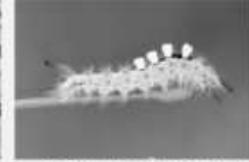
Le Bombyx antique Orgyia antiqua