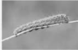
Le Bombyx du trèfle Lasiocampa trifolii