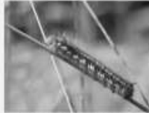
Le Bombyx buveur Euthrix potatoria