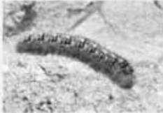
Le Bombyx du chêne Lasiocampa quercus