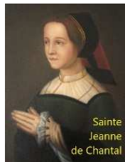
Sainte Jeanne de Chantal

https://www.alsace.catholique.fr/zp-trois-frontieres/cp-de-la-hardt-aux-collines