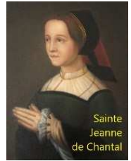
Sainte Jeanne de Chantal

https://www.alsace.catholique.fr/zp-trois-frontieres/cp-de-la-hardt-aux-collines