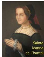
Sainte Jeanne de Chantal

https://www.alsace.catholique.fr/zp-trois-frontieres/cp-de-la-hardt-aux-collines