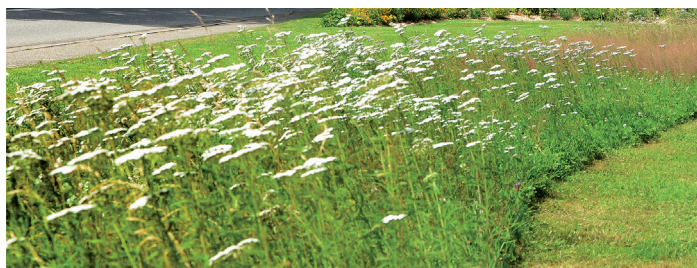
exemple de tonte différenciée